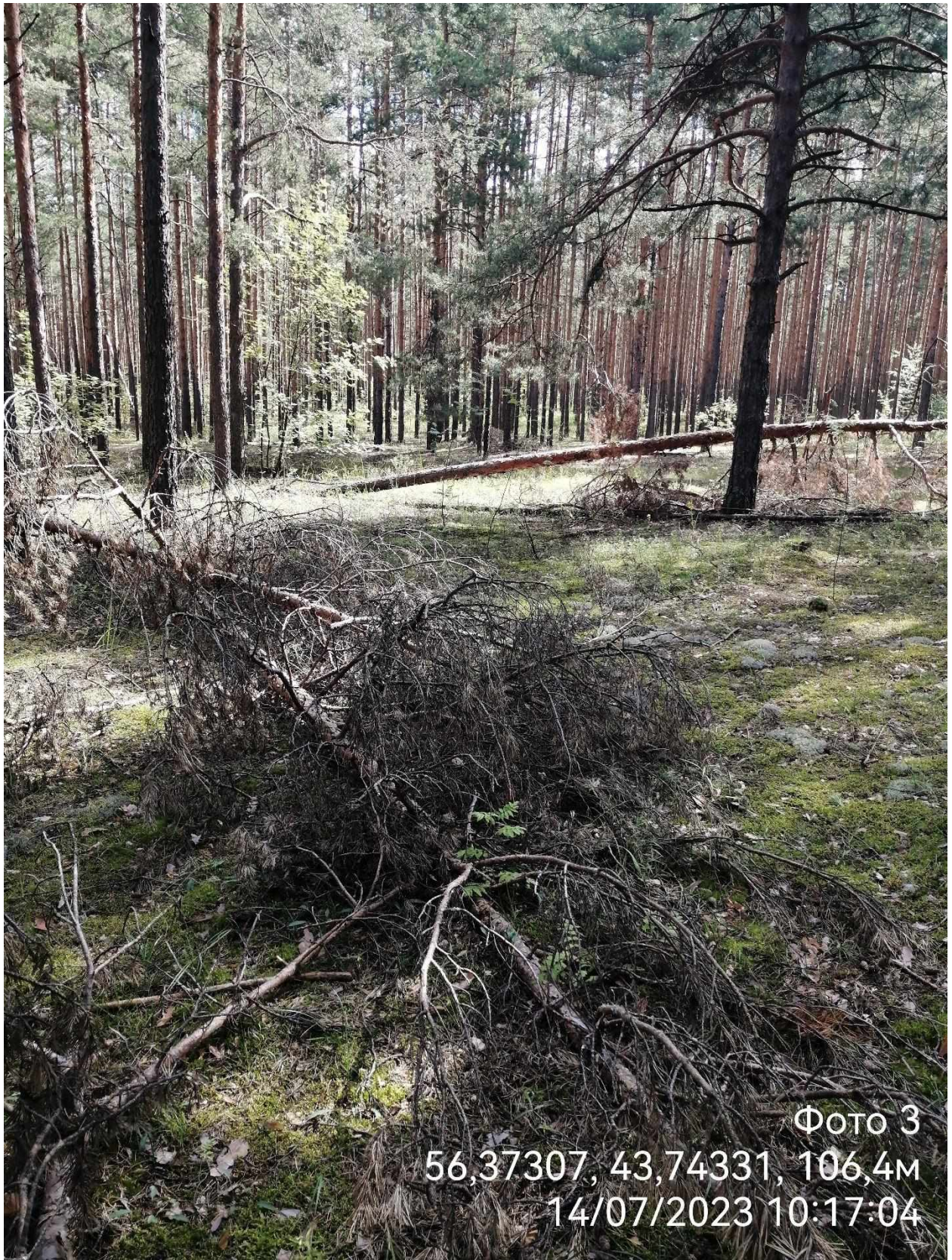
ФОТО 3 56,37307, 43,74331, 106,4М 14/07/2023 10:17:04